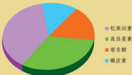
TLC展开图 (薄层分析法-紫色系) 蜂胶制品的类黄酮成分含量分布之分析表

蜂胶瑰宝是采用超临界CO 2 萃取技术生产的绿色蜂胶，可以避免破坏蜂胶的原始状态，使蜂胶原有的类黄酮可以充分保留。液状蜂胶可以直接到达胃肠，使身体不需经过多层的消化程序，人体细胞就可以直接吸收及利用蜂胶的类黄酮，使各器官的细胞正常化，恢复健康或精力充沛的迎向生活挑战。