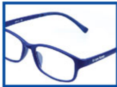
Blue/ Biru/ 宝石蓝