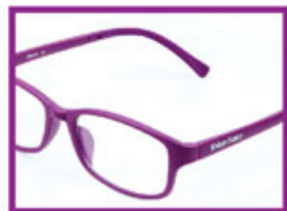
Purple/ Ungu/ 青莲紫