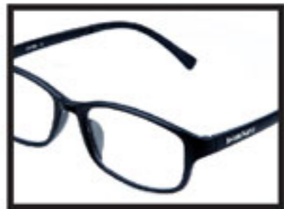
Black/ Hitam/ 睿智黑