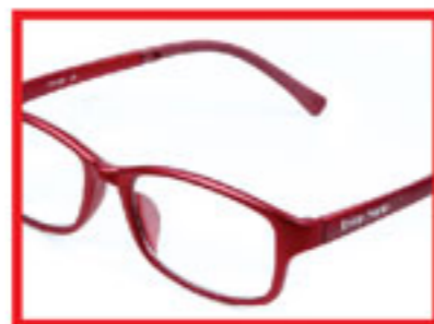
Red/ Merah/ 典雅红

Small Glasses Frame: Suitable for female